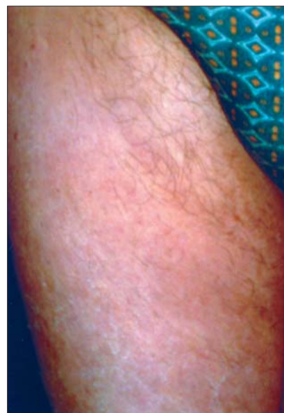
Fig. 5. Aspectul leziunilor după 11 zile de tratament

De asemenea s-a început terapia sifilisului conform schemei M.S. și formei clinice de boală.