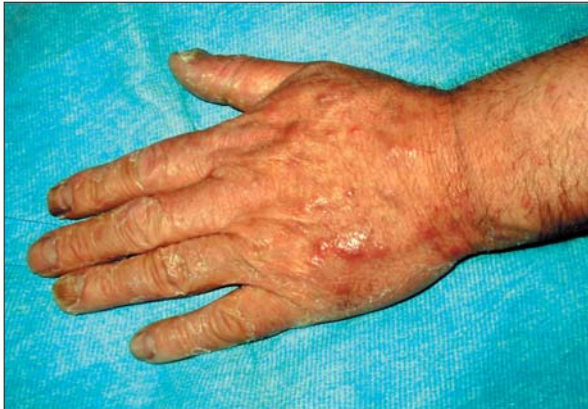
Fig. 3. Afectare unghială

De asemenea, unghiile de la ambele mâini sunt îngroșate, hiperkeratozice, cu depozit subunghial (fig. 3).