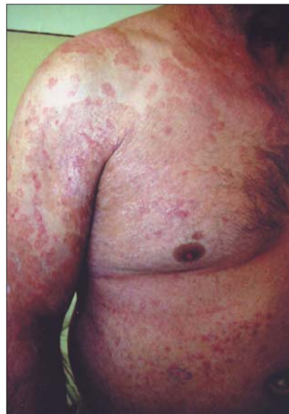
Fig. 1. Tinea corporis – leziuni eritemato-scuamoase pe trunchi și membrele superioare

Examenul dermatologic evidențiază o erupție generalizată alcătuită din leziuni eritemato-scuamoase, dispuse în plăci și placarde bine delimitate, cu contur circinat, centrul mai palid și periferie eritematoasă cu scuamă, la nivelul trunchiului și membrelor (fig. 1, 2). Erupția este însoțită de prurit moderat.